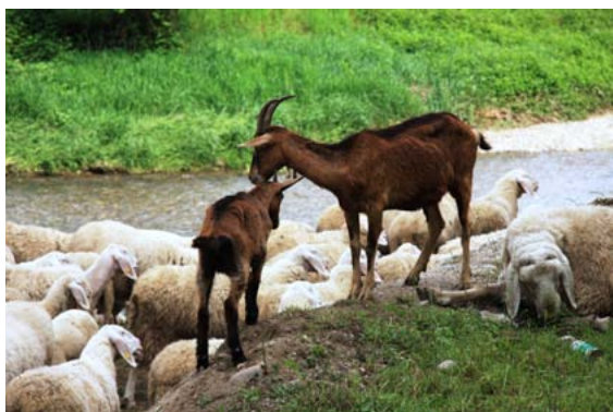
figura 3 - "Ristoro" di Colombo Angelo