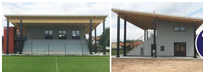
REALIZZAZIONE NUOVA TRIBUNA AL CAMPO SPORTIVO