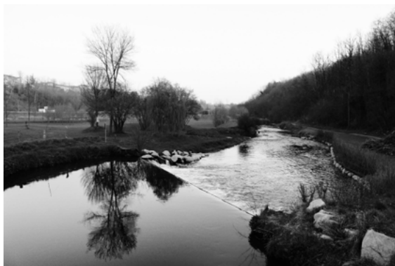
figura 2 - "Un solo percorso" di Ghiringhelli Lisa