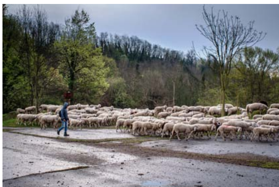
figura 4 - "Il pastore e il gregge" di Crosta Giorgio