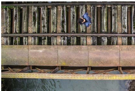
figura 1 - "Solitudine" di Roveda Mauro

La giuria , riunitasi il giorno 28 maggio, ha proclamato la foto vincitrice del concorso: "Solitudine" di Roveda Mauro (figura 1) . Sono state segnalate come meritevoli di una speciale menzione le seguenti foto: "Un solo percorso" di Ghiringhelli Lisa (figura 2), "Ristoro" di Colombo Angelo (figura 3), "Il pastore e il gregge" di Crosta Giorgio (figura 4).