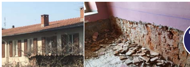
SISTEMAZIONE DELLE CASE COMUNALI