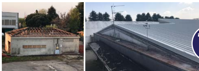
BONIFICA AMIANTO E MESSA IN SICUREZZA AREA EX TSG