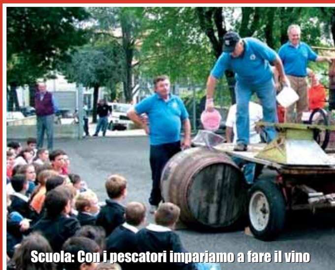
Scuola: Con i pescatori impariamo a fare il vino