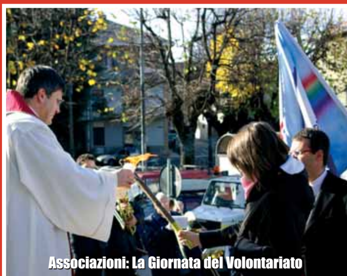
Associazioni: La Giornata del Volontariato