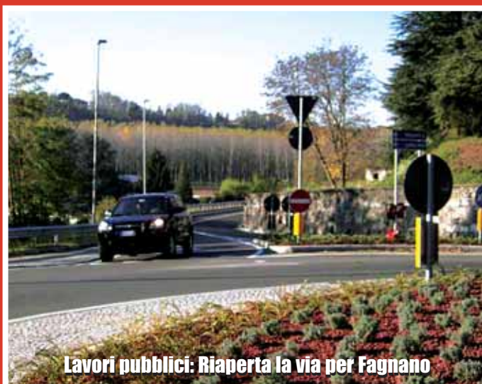
Lavori pubblici: Riaperta la via per Fagnano