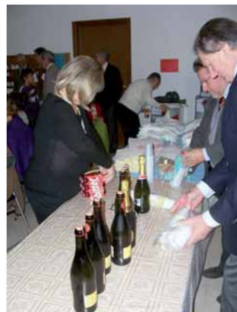
Il festoso rinfresco finale.