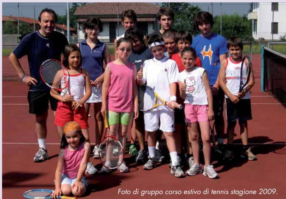
Foto di gruppo corso estivo di tennis stagione 2009.

Il Consiglio direttivo del TC GORLA MAGGIORE è così composto: