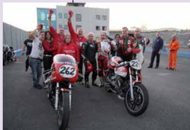
foto di gruppo dopo l'arrivo a Franciacorta il 25 ottobre 2009