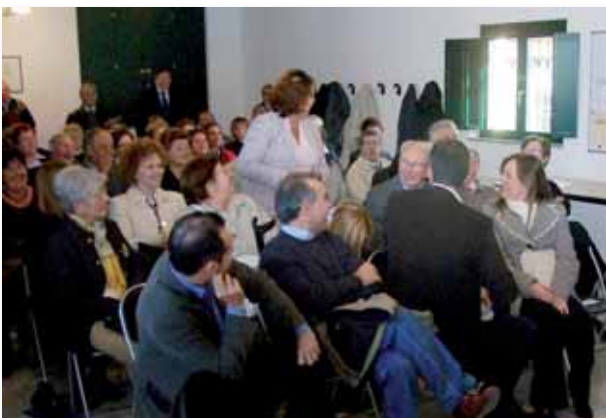
Una docente interviene per illustrare il suo programma.