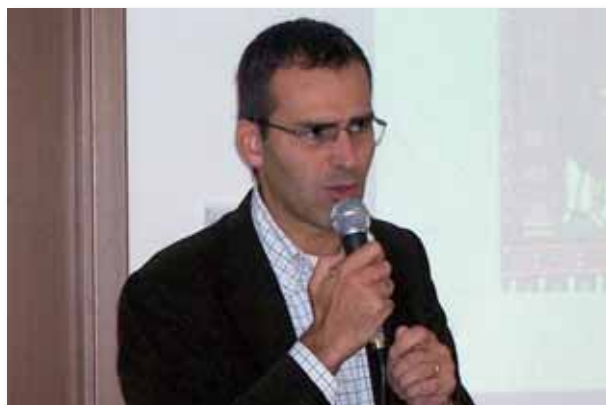
Il saluto del Sindaco.

NB: tutti i punti del programma saranno trattati con esempi letterari ed esercitazioni pratiche