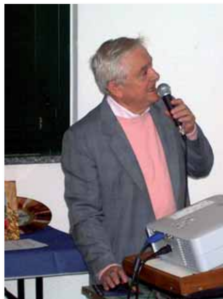
Il presidente illustra il programma.

Numerose, come al solito, sono le proposte per gite e viaggi. Tra queste quest'anno spicca la proposta per una "due giorni" a Rimini per la mostra selezione del "Museum of fine Arts di Boston" e a Ravenna.