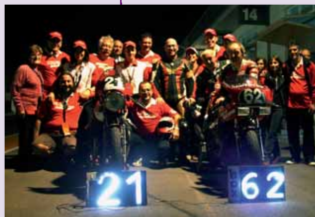
foto di gruppo dopo la vittoria a Cartagena il 26/09/2009